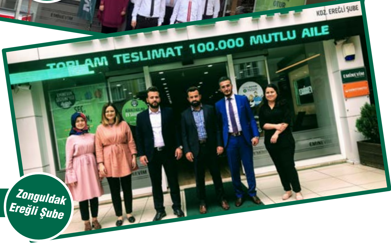
Zonguldak Ereğli Şube