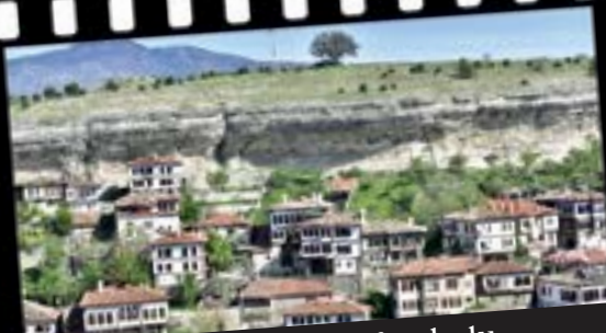
Faik Derici / Safranbolu