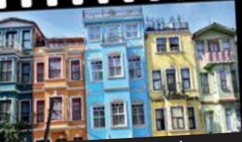
Hüseyin Güldemir / Balat