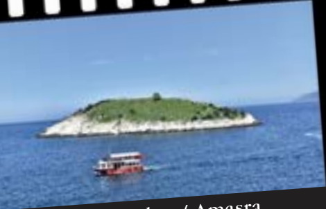
Şebnem Kayıkçı / Amasra