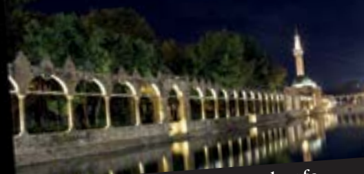
Hüseyin Güldemir / Şanlıurfa