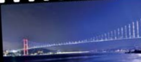
Hüseyin Güldemir / İstanbul