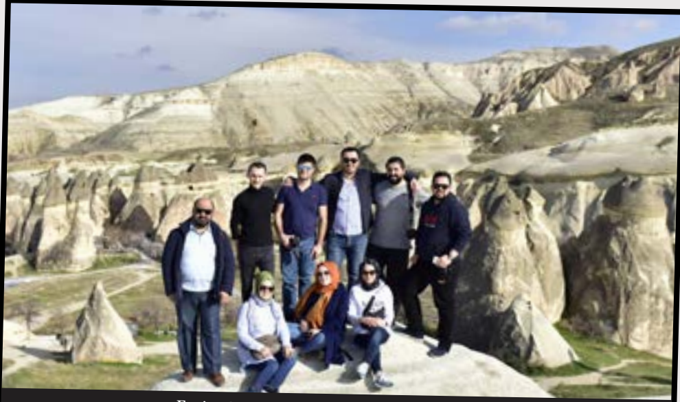
Emin Grup Fotoğrafçılık Kulübü Üyeleri