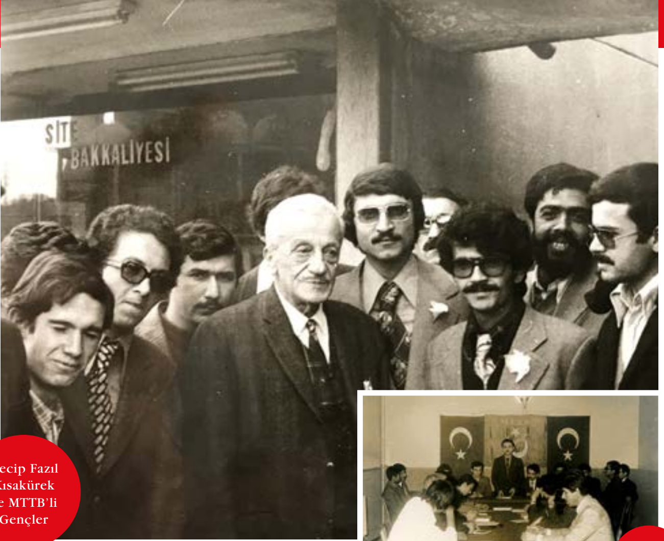
Necip Fazıl Kısakürek ve MTTB'li Gençler

Allah bunlara bereket verecek. İnşallah yıllar sonra bundan büyük hayırlar çıkacak.