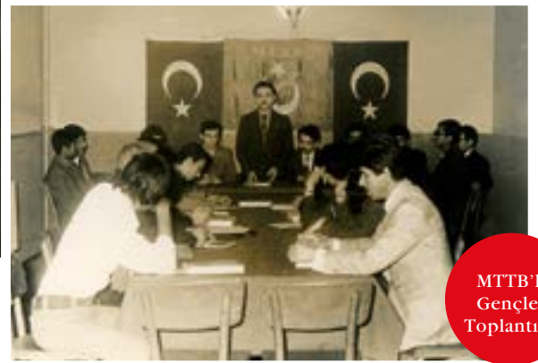
MTTB'li Gençler Toplantıda

Biz bir avuç insandık, MTTB'de. Ama düşünün cumhurbaşkanları başbakanlar meclis başkanları çıktı içlerinden. Demek ki bu bir bereket Allah'ın bereketi bir avuç insandan Cenabı Hak bir sürü hayır halk etti, yarattı. Ben gençlere de bunu anlatıyorum. Yaptığımız faaliyetleri küçük görmeyin, Allah bunlara bereket verecek. İnşallah yıllar sonra bundan büyük hayırlar çıkacak.